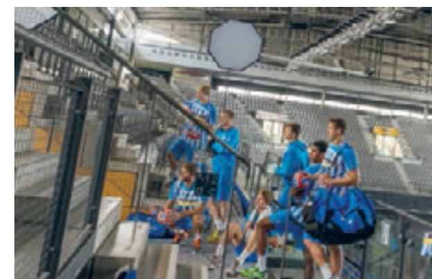
Das Werbemotiv unserer Bankier Kampagne mit den WILD BOYS entstand in der Porsche-Arena in Stuttgart.

GEMEINSAM MEHR ERREICHEN: WENN MENSCHEN ETWAS BEWEGEN.