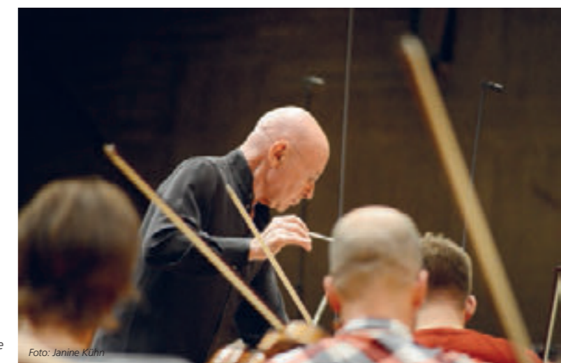
Stardirigent Christoph Eschenbach bei den Proben zur KLASSIK.PLUS Premiere mit den Stuttgarter Symphonikern.

mit syrischen Flüchtlingen ein Argument für die Nominierung durch die 31-köpfige Expertenjury aus Kultur, Wirtschaft und Medien. Die Förderung von Kunst und Kultur sowie des karitative Engagement der Stuttgarter Symphoniker haben die Volksbank Stuttgart eG dazu veranlasst, Sponsorpartner des Sinfonieorchesters zu werden.