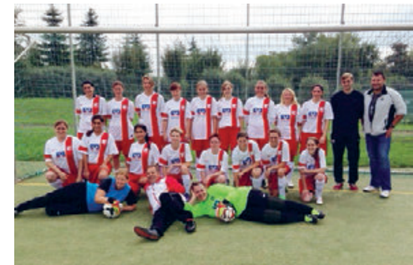
Mit ihren Spielerinnen ist die Damenmannschaft der Fußballabteilung in Oeffingen gut aufgestellt.

Vorbilder wie Sami Khedira geben jungen Menschen Antrieb und Ziele. Die Förderung von lokalen Sport- und Bewegungsangeboten liegt der Volksbank Stuttgart eG im Rahmen ihrer Sponsoringmaßnahmen sehr am Herzen. Beim TV Oeffingen engagiert sich die Bank daher mit Geldern, die unter anderem für Trikotwerbung eingesetzt werden und damit die Mannschaften finanziell unterstützen.