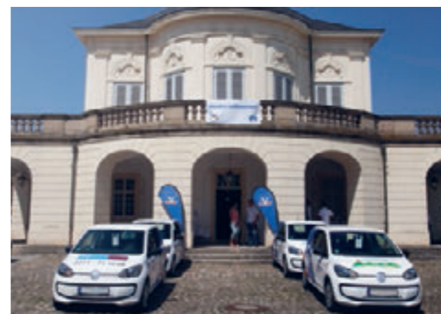
Übergabe der VR-Mobile der Volksbank Stuttgart eG vor dem Schloss Solitude im Juli 2014.

Engagement von der Volksbank Stuttgart eG ein neuer VW-Up als Leasingfahrzeug zur Verfügung gestellt. Für ganze drei Jahre fährt seit vergangenem Sommer die Diakoniestation Möhringen-Sonnenberg-Fasanenhof nun in blau/orange durch die Region.