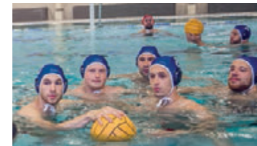
Die Wasserball Mannschaft des SV Cannstatt wurde im Sommer 2014 im Rahmen der Bankier Werbelinie abgelichtet.