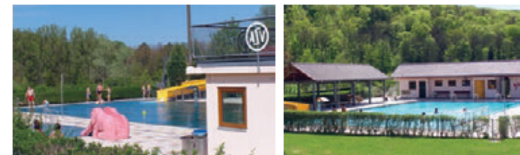
Das neue ASV-Freibad in Stuttgart-Botnang.